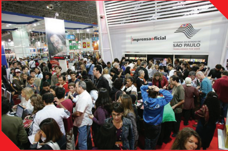
Bienal Internacional do Livro de São Paulo