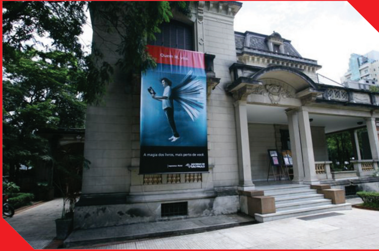
Casa das Rosas - Livraria Imprensa Oficial