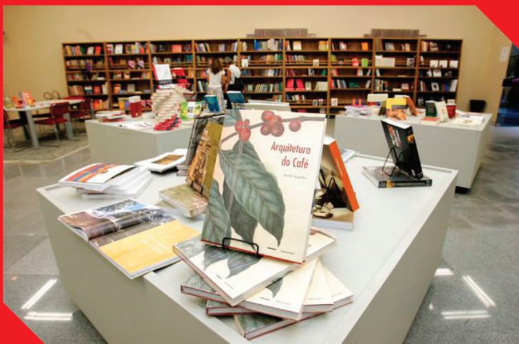
Livraria Imprensa Oficial - Rua XV de Novembro