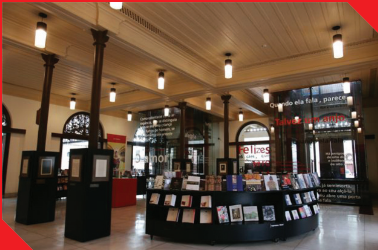
Espaço Imprensa Oficial - Museu da Língua Portuguesa