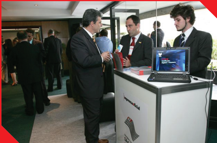
Certificação Digital - 6º CertFórum - SP